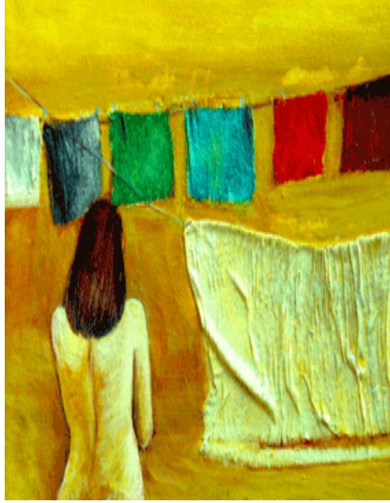
خهريبي و خهونهك